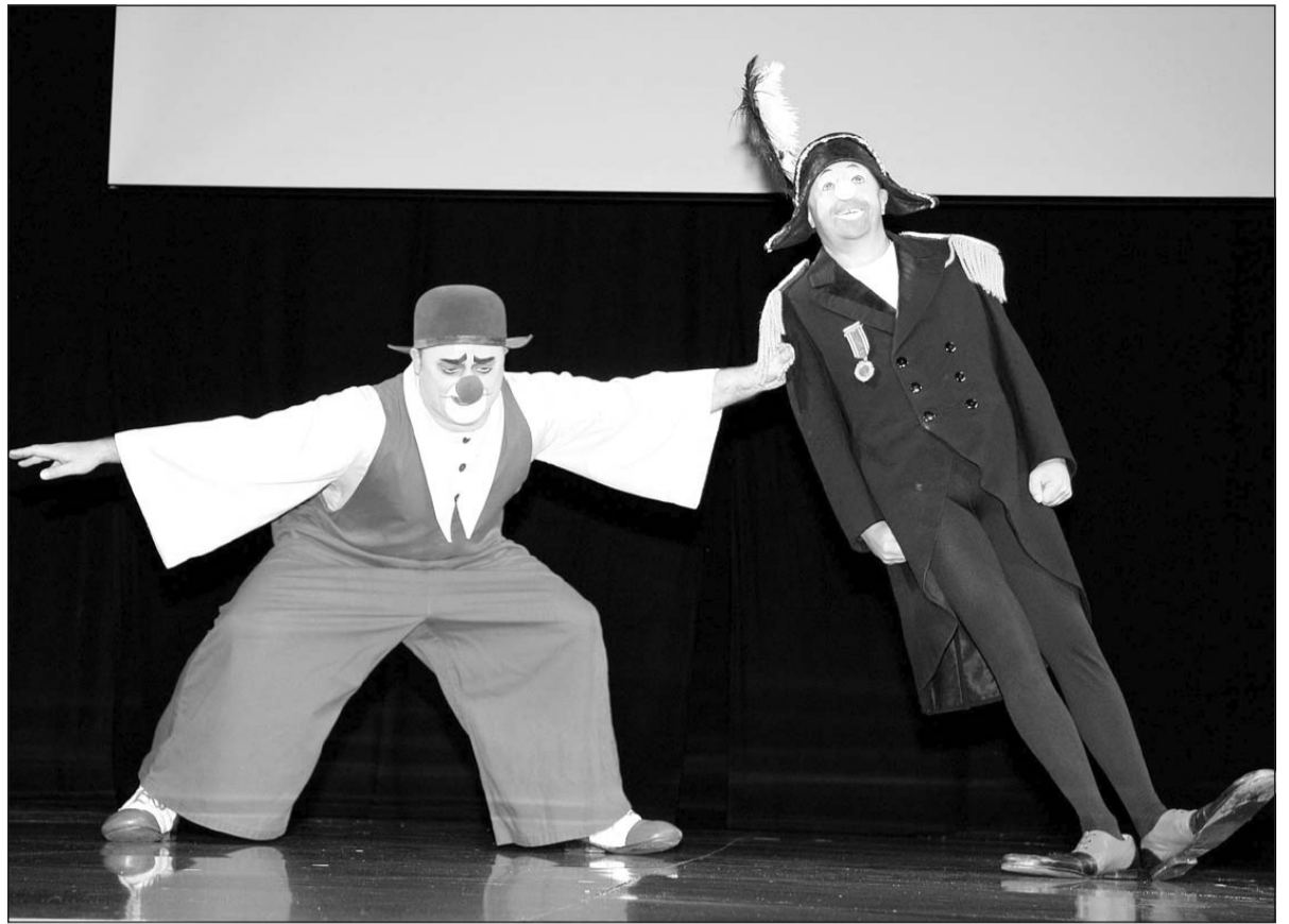
Die KGB-Clowns aus Russland beweisen, warum ihr Name »Kunst der Gestik und Bewegung« bedeutet: Nicht nur mit ihrer Wachsfiguren-Nummer haben sie die Lacher auf ihrer Seite.

die Abstimmung, ob er »Graf von Rietberg« werden solle, locker – kein Wunder, denn »Nein« können die Besucher auf den Stimmzetteln gar nicht ankreuzen. Sie knüpfen aber Bedingungen an das Grafenamt. »Er soll die Bundesgartenschau nach Rietberg holen«, heißt es auf einem Stimmzettel, ein anderer Besucher wünscht sich, von Blickensdorf möge einen Rasierscham für Rietberg kreieren. »Ganz getreu dem Motto »Stoppeln wachsen lassen«, witzelt Martin Quilitz. Blickensdorf verspricht, eine eigene Währung, den »Doppelten Rietberger«, einzuführen und Rietberg nach dem Vorbild Liechtensteins zum Steuerparadies zu erklären. »So locken wir dann Schumi und Boris Becker an«, orakelt Martin Quilitz. Vielleicht fühlen sich die Promis im Erholungsort ja wohl.